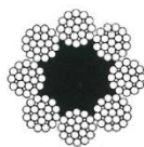
JIS 8 x Fi(25) FC